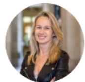
Constance Le Grip

Secrétaire du Sénat Membre de la commission de l'aménagement du territoire et du développement durable Membre de la délégation aux droits des femmes et à l'égalité des chances entre les hommes et les femmes