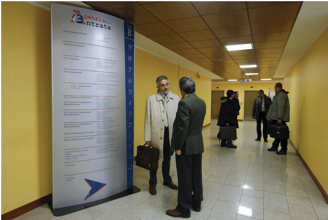
Locaux du siège du Trésor public à Rome : le pays pratique l'imposition à la source depuis 1973

source englobe les salaires, les retraites, les indemnités maladie et de chômage. En sont exclus les plus-values mobilières et immobilières, les revenus des capitaux mobiliers et les stock-options . Le changement de modèle présentait le risque de favoriser les comportements opportunistes. Afin d'éviter ces effets d'aubaine, seuls les revenus récurrents sont concernés. La loi du 29 décembre 2016 de finances pour 2017 propose une liste de revenus exceptionnels qui seront néanmoins imposés, tels que la part imposable des indemnités de licenciement, les cessions d'activité, les retraites versées sous forme de capital, les plans d'épargne salariale, la participation au bénéficiaire et l'intéressement, ainsi que les indemnités en réparation d'un préjudice moral. L'administration a créé un crédit d'impôt modernisation du recouvrement (CIMR) ; il annule l'impôt qui aurait dû être payé en 2019 sur les revenus de 2018 sans la mise en œuvre de la réforme.